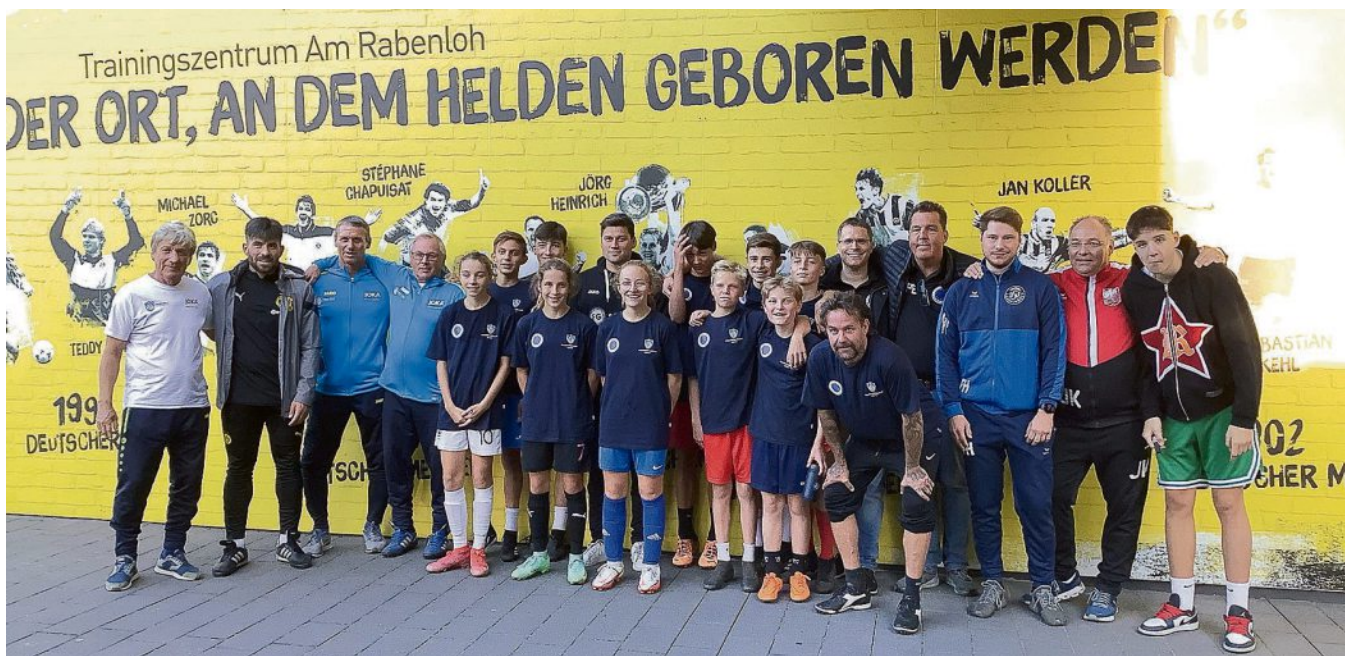
Das Orga-Team von Kids for Europe zusammen mit einigen Spielerinnen und Spielern.

Zum Abschluss wartete auf die Teilnehmenden eine Stadionführung im Signal Iduna Park – zur besonde-