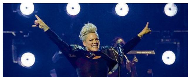
Pinks Konzerte sind stets große Inszenierungen.

Die Sängerin ist bekannt für ihre spektakulären Liveshows mit kolossalen Inszenierungen, gepaart mit viel Talent. Ihre Tour – gewiss ein Jahreshighlight.