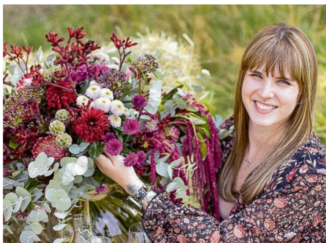
Chrysanthemen können für stetige Abwechslung in der Vase sorgen.

Blumen Risse: Blütenvielfalt für die Vase